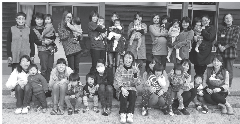
おひさまのようにあったかい支援室で遊ぼう

おひさまひろばは、元気な子どもたちがいっぱいいます。お母さんたちもとても仲が良く、子育ての悩みを話し合ったり、いろいろと情報交換ができる集いの場です。おもちゃもたくさんそろっています。ねんねしている赤ちゃんも、ハイハイする赤ちゃんも大歓迎です。遊びに来てください。