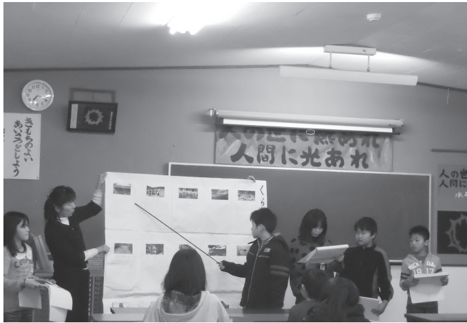
小学生が協力し合って成果を発表

本年度は、「差別に負けない仲間づくり」「何かのときに手を差し伸べることのできる関係づくり」に取り組み、