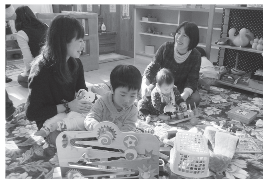
支援室にはおもちゃがいっぱい