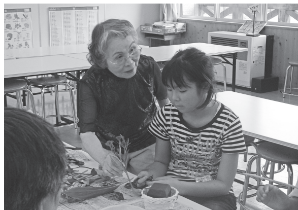
フラワーアレンジメント指導 (敬老参観日)

なお、学校からは樹木の剪定や除草作業などの要望も多々ありますので、今後も学校支援ボランティアの皆さんの力をお借りしたいと思っております。よろしくお願いいたします。