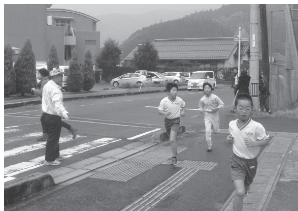
校内マラソン大会安全指導