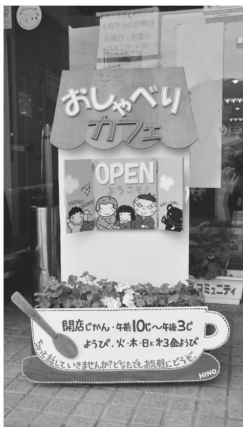
『おしゃべりカフェ』は、毎週火・木・日曜日と第3金曜日に開いています。ぜひお立ち寄りください。

新年も公民館は、つなげようつながろう生涯学習でまちづくりの輪”を合言葉に、事業の運営・活動をしたいと思えます。どうぞよろしくお願いいたします。