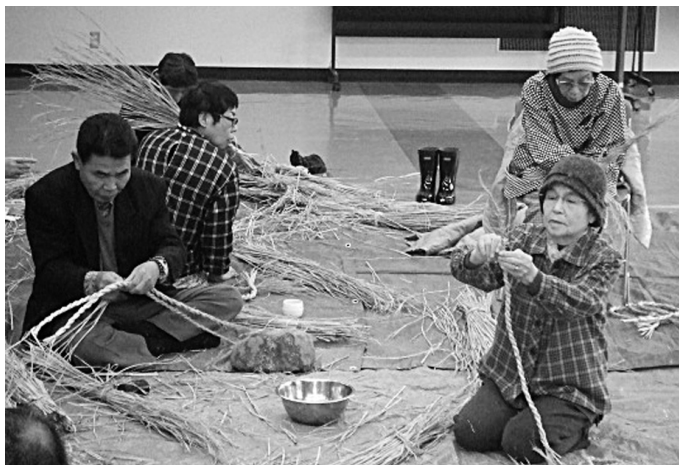
手作りのしめ縄で迎える新年に期待する参加者ら