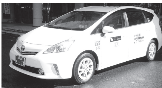
平成25年11月、ハイブリッドの福祉タクシー車両購入費に活用しました