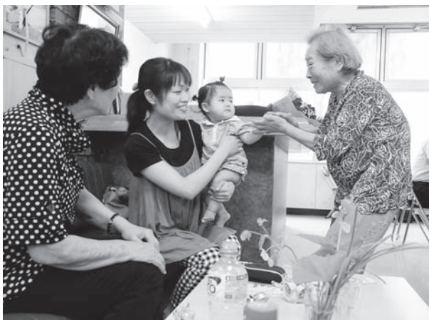
おいしいコーヒーを飲みながら話が弾む