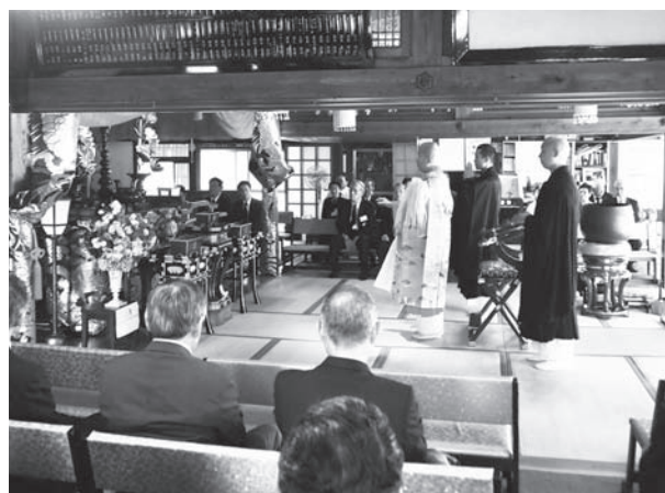
厳かに行われた法要