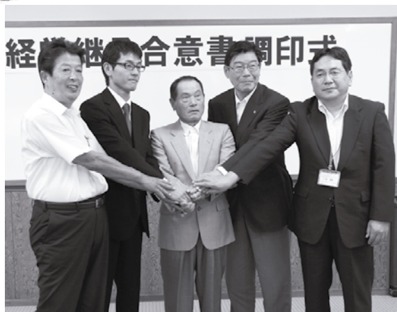
見届けた関係者が2人にエールを送る