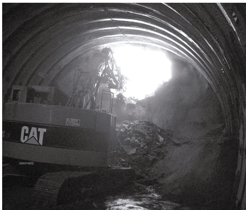
重機が最後の土壁を崩した瞬間。まばゆい光がトンネル内に差し込んだ

黒坂と伯耆町をつなぐ主要地方道日野溝口線の矢倉峠を貫く、延長422mの矢倉トンネル貫通式が、7月9日に行われました。