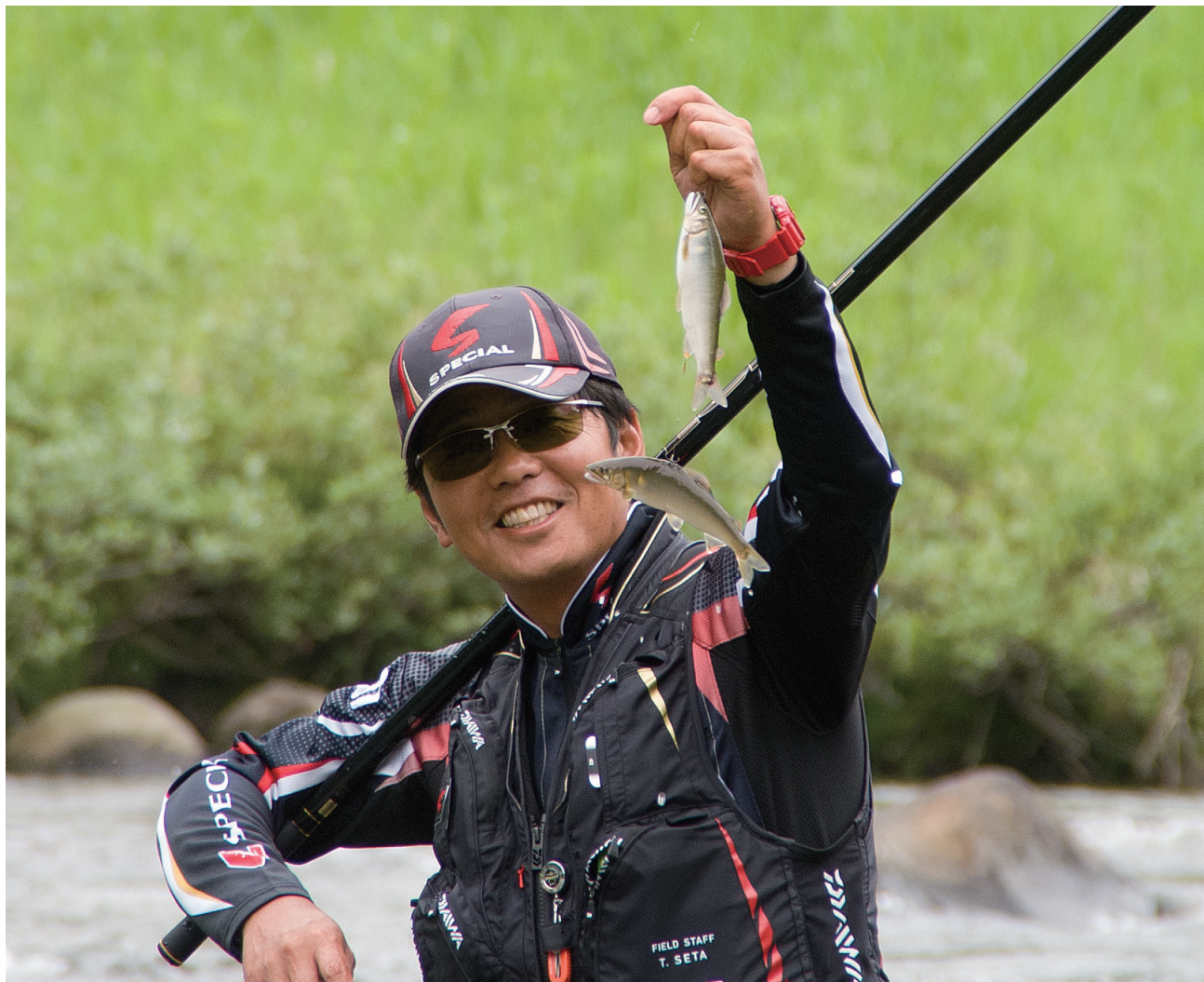
ふるさと日野の四季彩 - 写友会ひの -