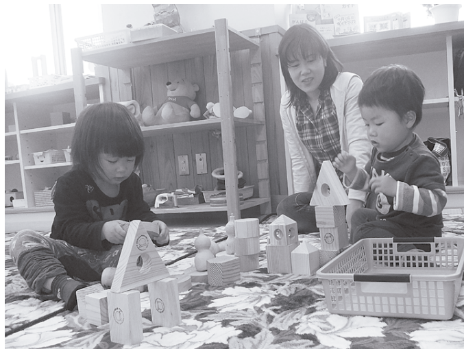
真剣に積み木を積む小さな手に、お母さんもしっかり