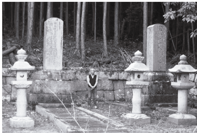
人物と比べるとその大きさが分かります