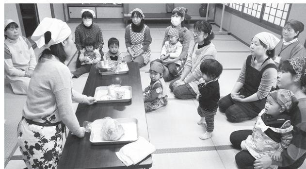
説明聞いて、何に挑戦する？