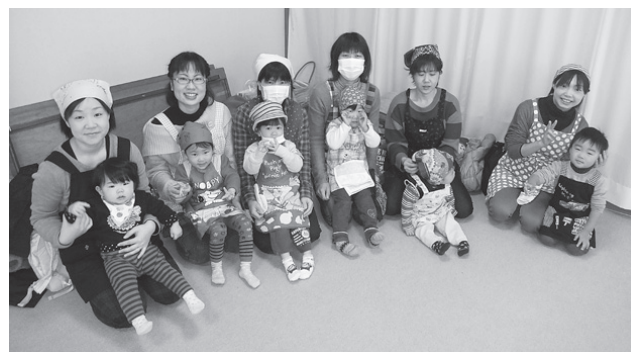
準備万端、さあ今からクッキング！

◆2月28日(木) 開発センターで、食生活改善推進協議会員さんや町管理栄養士の協力で親子クッキングを開き、にぎやかに会食しました。小さな手でキャベツをちぎる、両手に力を入れマッシャーで豆腐と鶏ミンチを混ぜるなど、エプロンと三角巾をした小さなシェフたちは目を輝かせてクッキングしました。