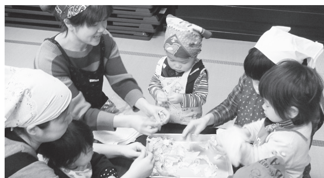
キャベツをちぎってちぎってクッキング