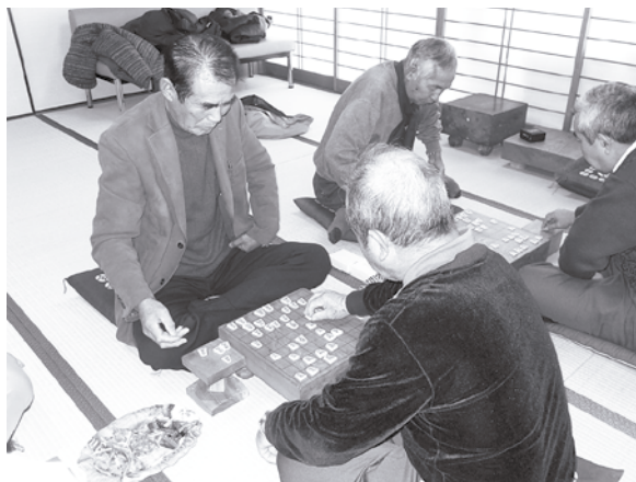
一手、一手に力が入る