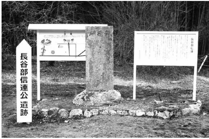
屋敷跡にある看板は、1月に修復工事を行いました

現在の下榎1区の西端には、信連の屋敷跡があります。ここは、東西85メートル、南北70メートルの広さがあり、堀の跡や建物の礎石が残っています。