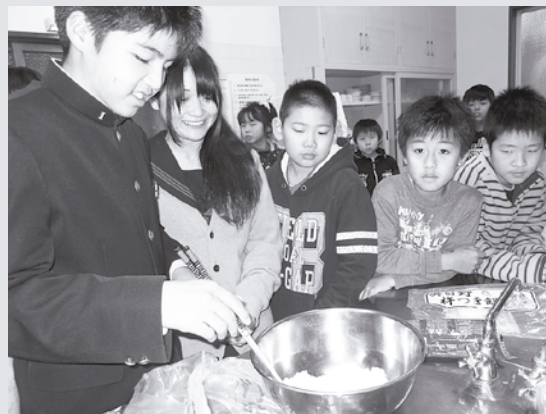
小学生と中学生がふれあう

1月15日、小中合同で学習会を開き、交流を深めました。今回は、中学2年生が中心となって計画を立て、“みんなでもちをたべよう”というテーマのもと、小学生13人、中学生11人が3班に分かれ「きなこもち」「砂糖醤油もち」「ぜんざい」と、それぞれ好みのお餅を食べました。おもちを茹でたり、きなこを作ったりと中学生がリードしながら楽しく交流できました。残り2カ月でそれぞれ進級します。中学3年生は学習会も卒業になりますが、小学生との交流の中で“つながっている”ということを実感しながら新しい一歩を踏み出していったらいいと思います。