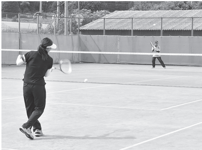
頭本さん(手前)はチームメイトを指導する