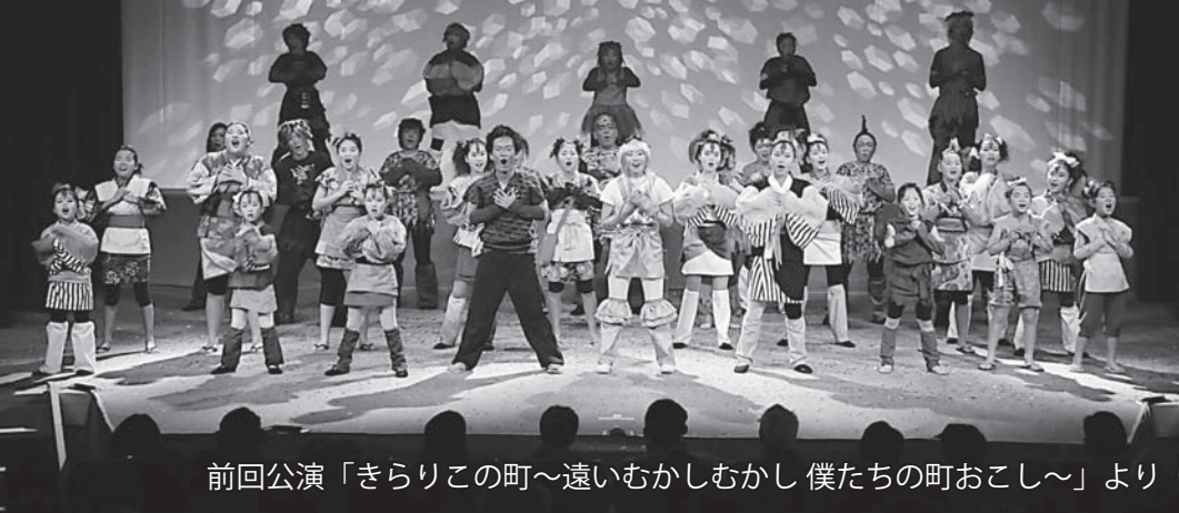
前回公演「きらりこの町～遠いむかしむかし僕たちの町おこし～」より