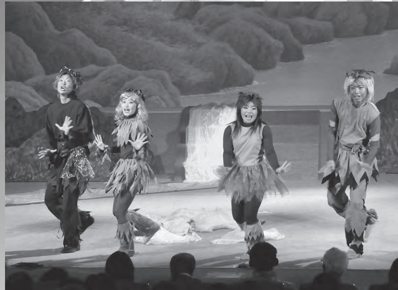
元気いっぱいの歌と踊りのカッパたち