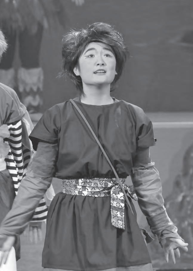
きすな 楓馬の不思議な力が、みんなの絆を深めていく