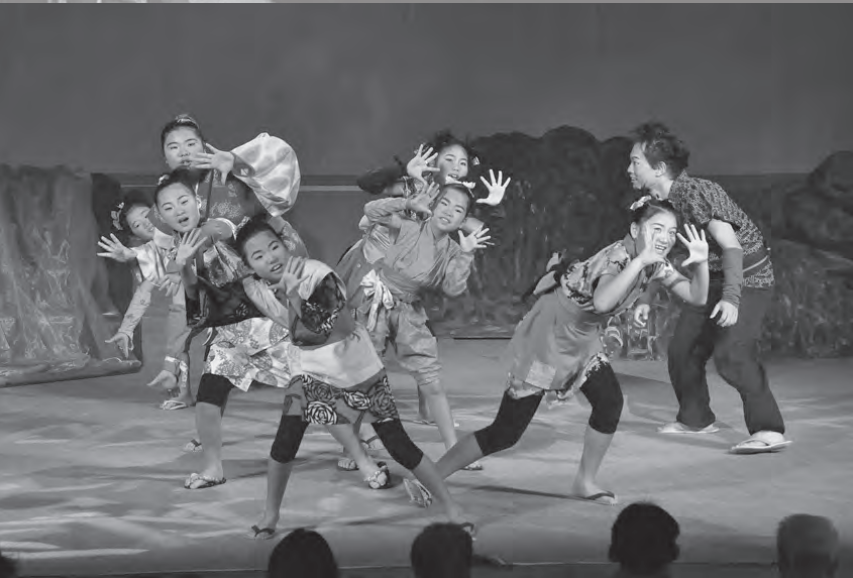
表情豊かに演技する村の子たち