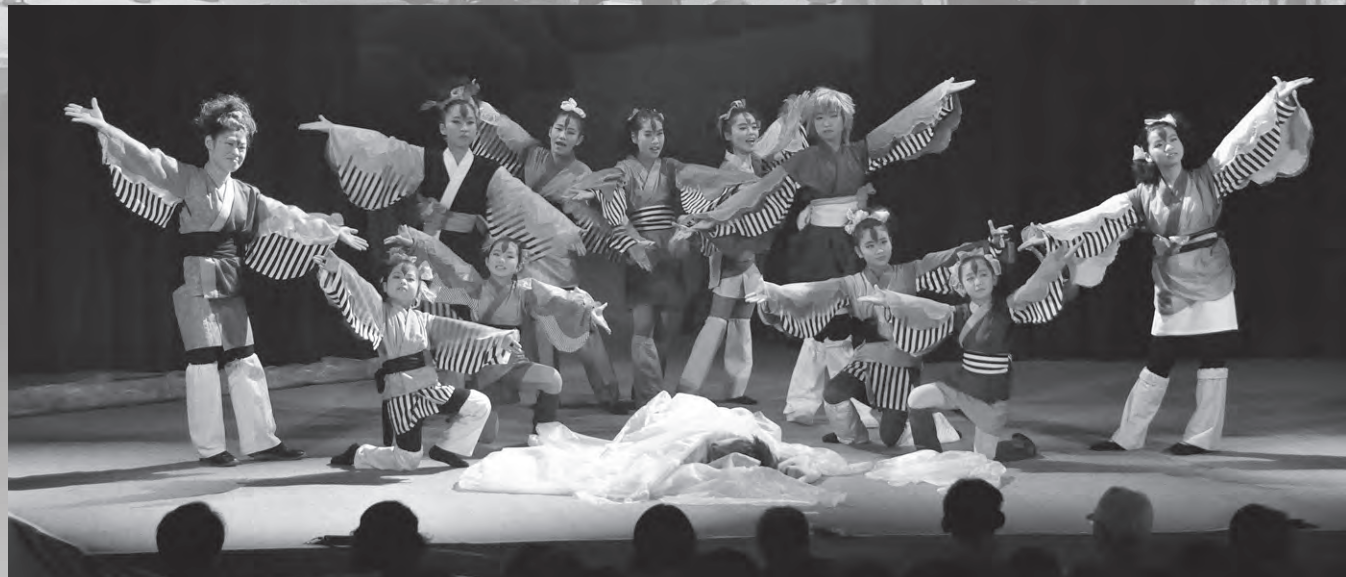
オシドリたちは美しい姿と舞で観客を魅了する