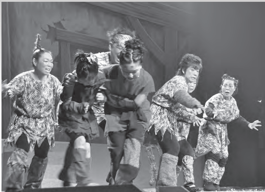
鬼たちから逃げる村の子。鬼はその力で村を支配しようとする