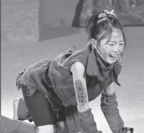
鬼が支配するたたら場から 逃げてきた村の子たち