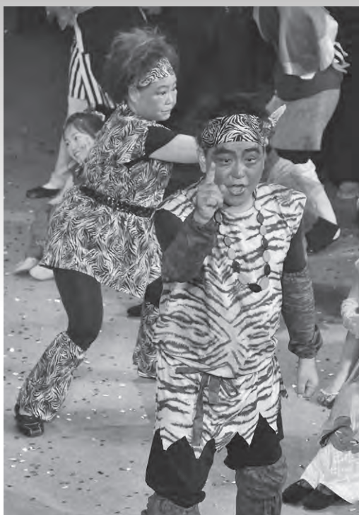
圧倒的な存在感を示す鬼たち