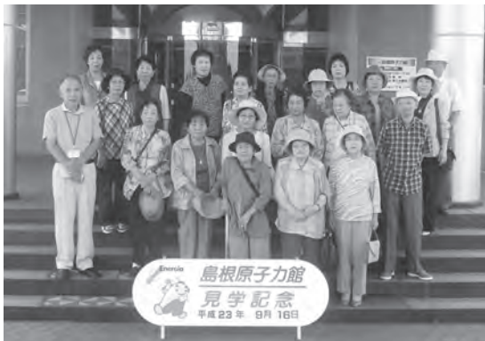
多くの学園生が参加した町外研修