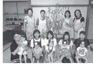
▲願い事を飾った七夕飾りと一緒に。みんなの願いがかなうといいな

7月7日：七夕まつり(町公民館)♪歌・合奏♪ みんなの願いがお星さまに届きますように…★