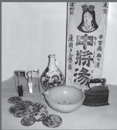
懐かしい生活雑貨などを展示します(写真はイメージです)