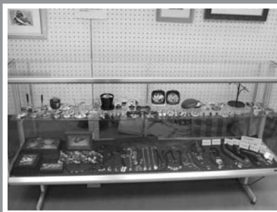
きれいな七宝焼が数多く展示される