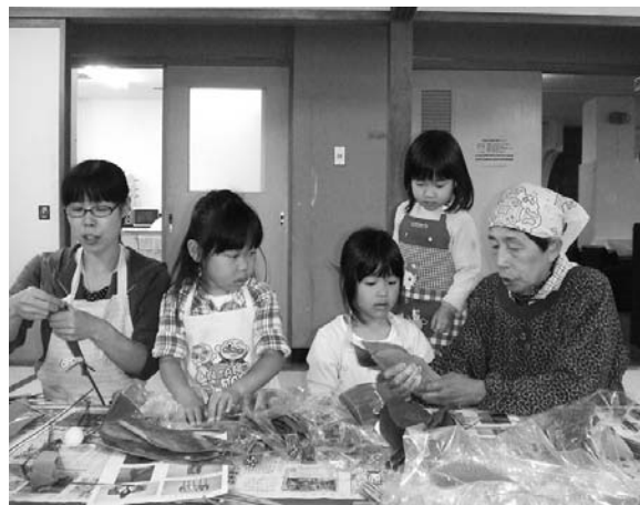
ゆっくり、やさしく教わる