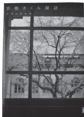
どうして、桜は美しいのでしょうか。癒されます

日野町図書館おすすめの1冊コーナー 読んでみたらかな 京都さくら探訪 ナカムラユキ 著 大雪に悩まされた冬も終わりを告げ、なんとなくウキウキとした気分になる春がようやくやってきました。桜の開花ももう間近！塔の峰にもぼんぼりが灯っています。 もちろん日野町にも桜の名所はいろいろありますが、桜が咲く時期に全国から観光客が殺到する場所といえば・・・その「やっほり京都」この本には、そんな京都ならではの桜の楽しみ方が美しい写真と共に紹介されています。 たとえば、そぞろ歩きしながら見る「哲学の道」の桜。窓越しに見る「京都府庁旧本館」の中庭の桜。電車に乗って見る「嵐電」の桜など、「桜」とその景色を丸ごと楽しむオススメの見方が載っていて、見るだけでも春めいた楽しい気分♪ これからは春本番。日野町にも、京都にも、そして震災のあった地域にも、たくさん桜が咲くことを祈っています。（図書館 山川）