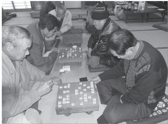
真剣勝負！次の一手に勝負をかける