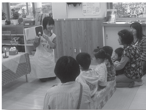
本の世界に引き込まれる子どもたち(子育て支援室)

また、1冊の本を家族や友達と読んで、一言感想を書いて次の人に回し、簡単な本を作る「読書リレー」にも20組が参加。高校生のグループや家族で作った楽しいイラスト入りのものなど、すてきな冊子が仕上がりました。11月中旬に図書館で行った「日野町子どもの読書あゆみ展」に展示しました。「読書マラソン」、「読書リレー」の入賞作品には、それぞれ賞状と記念品が学校や図書館で贈られます。