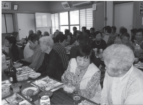
おいしい料理に楽しい会話の花が咲く