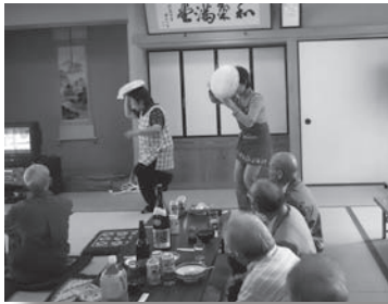
息の合った演芸で盛り上がる