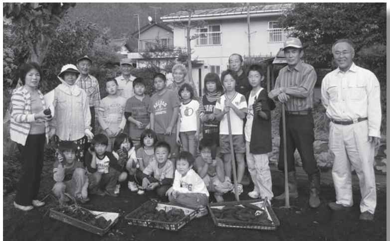
たくさんサツマイモが取れました

10月12日、榎の実学習会の児童と、榎の美老人会の会員が6月に一緒に植えたサツマイモの芋掘りを行いました。 どんなイモができているか楽しみにしていた児童たちは、力いっぱいつるをひっぱり、大きなイモや小さなイモがたくさん収穫できました。 芋掘りの後は、お待ちかねの試食。自分たちで掘ったイモの味は格別で、とても甘く、秋の味覚を思う存分堪能しました。