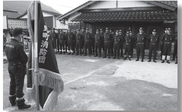
訓練を振り返り、気を引き締める消防団員