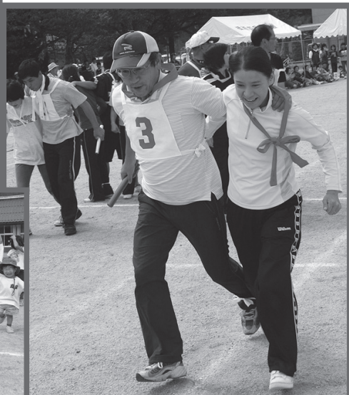
2人3脚おしどりリレー（根雨）