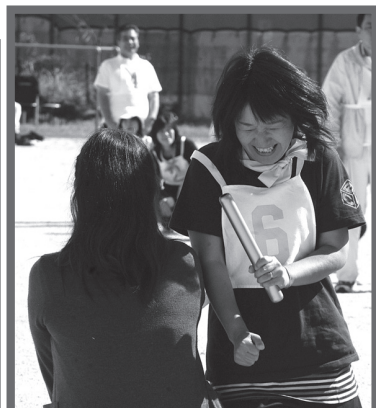
じゃんけんで苦戦！（根雨）