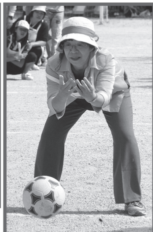
よく狙ってーそれ行け（根雨）