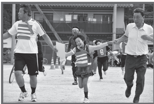
借り物競争！そろってゴール（黒坂）