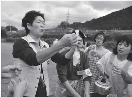
日赤奉仕団の会員から炊き出し訓練の指導を受ける

夏季訓練は、毎年、町内の各自治会を訓練場所とし、実際の災害に対応できるように計画して行われています。