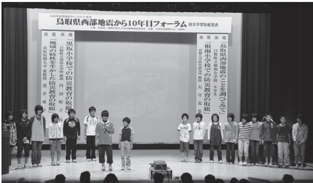
学習したことを自信を持って発表

根雨小学校6年生は、地元の人に聞いた被災体験など半一年間にわたり学習してきたことをまとめ発表し、「地震は怖いこと。自分たちが伝えていきたい」と感想を述べました。