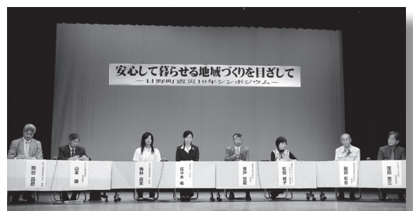
震災直後の様子を振り返る参加者

また、これから安心して暮らせる地域づくりや若者定住、産業振興など町がかかえる課題を話し合いました。