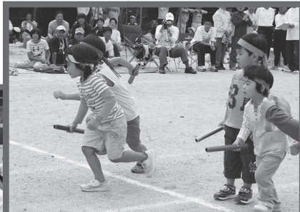
元気よく旗とり（黒坂）