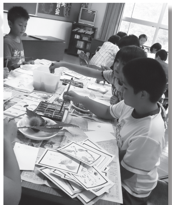
1枚1枚、心を込めて仕上げている

ぜひ、お誘い合わせて、お出かけください！ 詳しくは、ポスター・ちらしで案内します。