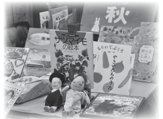
季節に合った、おすすめの本がずらりと並び