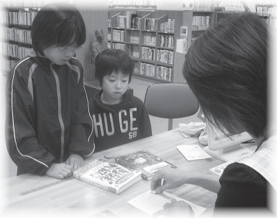
読んだらスタンプを押してね

まちで子どもたちの読書の推進に取り組んでいる様子を写真で紹介します。ぜひ、ご覧ください。