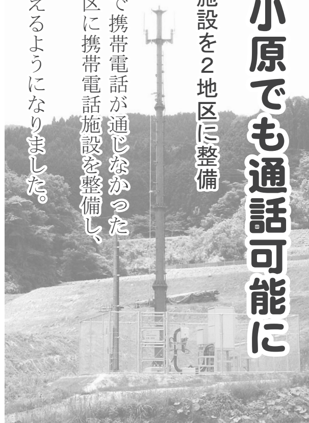
携帯電話施設「日野小原局」

町では、今まで携帯電話が通じなかった三土と小原地区に携帯電話施設を整備し、5月下旬から携帯電話が使えるようになりました。