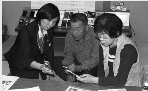
実際に携帯電話に触れてみました

携帯電話施設の完成に合わせ、5月23日に小原、24日に三土で、NTTドコモによる携帯電話教室を開き、延べ25人の地域の皆さんが参加しました。