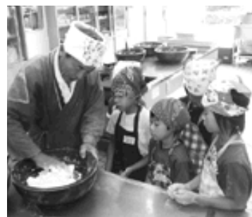
大人はやっぱり上手だなあ

出来上がった生地は、なんと車のボンネットの上に置いて30分寝かせました。その間、うどんの具になる夏野菜の天ぷらづくり。地域の大人たちが上手に揚げてく