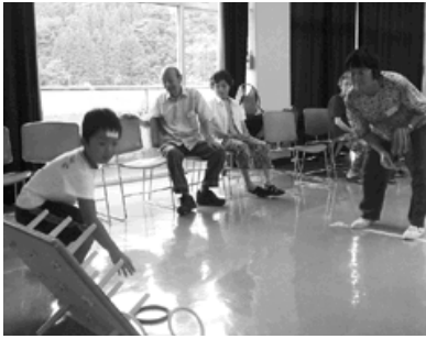
意外と難しい輪投げ