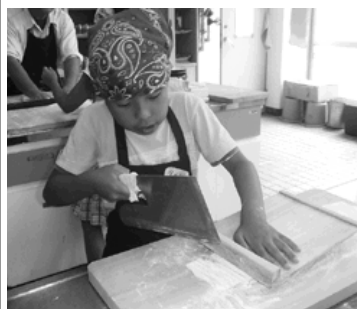
うまく切れてるかな...

だきました。子どもたちは「おいしそう」と試食を楽しみにしていました。さらに、生地を伸ばして、太くなったり細くなったりしながら自分で切ってみました。大きな鍋でゆでると、食べるのに苦労するほどのコシの強いうどんができました。器にうどんを入れ、天ぷらを盛り、上からつゆをかけておいしくいただき、作る楽しみや食べた感動を参加者全員で分かち合いました。