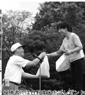
優勝者には日野産菓をプレゼント