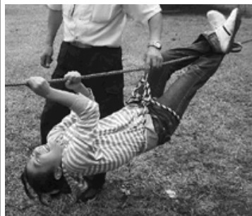
初めての体験がいっぱいでした

野外活動体験「鵜の池で、ロープを使った体験と飯ごう炊飯をしました。木と木の間でロープを張り、1人ずつ渡りました。大人に支え