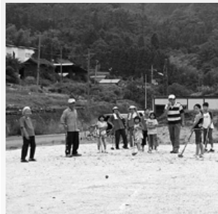
みんな一緒にプレー

子どもからお年寄りまで、誰でも楽しめるグラウンドゴルフなので、「今度は大会をやりたい」という意見が子どもたちからもありました。