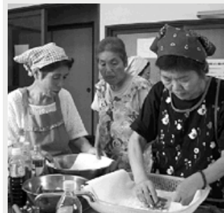
協力して作りました

今回は、食生活改善グループの皆さんの指導により、アジの香り漬け揚げなど、5つのメニューに挑戦しました。