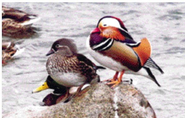
『いつまでも平和で穏やかに』

エネルギー: 366kcal たんぱく質: 12.8g 脂質: 11.8g 食塩相当量: 1.1g