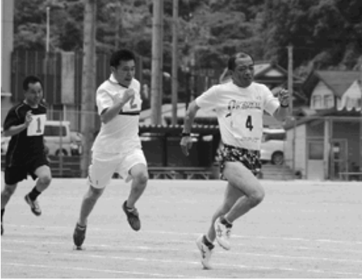
ゴール目指し疾走

日野町選手団は全ての競技に出場しました。健闘の結果、総合得点ではわずか5点差で日南町に敗れ第2位となり、6年連続の総合優勝は果たせませんでした。軟式野球やソフトテニス壮年の部などの7種目で優勝を果たしました。