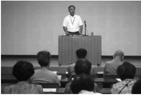
身近な社会問題を学習

また、「部落差別はなくなった」という意識調査も多いが、現実はなくならない。直接的な差別から、落書きやインターネットを介し自分を隠して攻撃するなど、残忍で陰湿化している。この社会情勢ですますすひどくなっているのが現状」と説明しました。