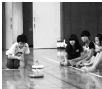
カローリングは慎重に

友達を応援する子や進行を手伝ってくれる子など、自然と役割が生まれ、みんなで取り組むことができました。伝承玩具づくり体験「公民館の中で、竹とんぼや牛乳