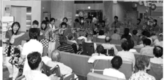
有志による踊り「家族っていいな」