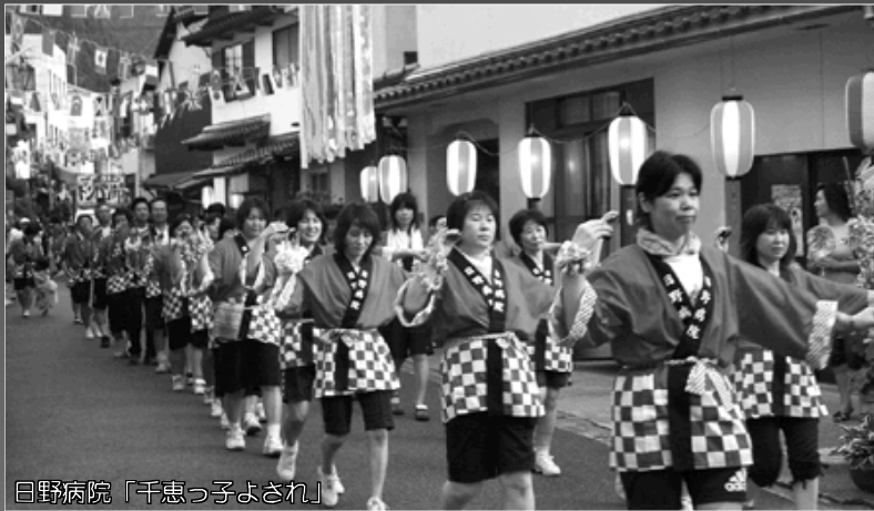
日野病院「千恵っ子よされ」