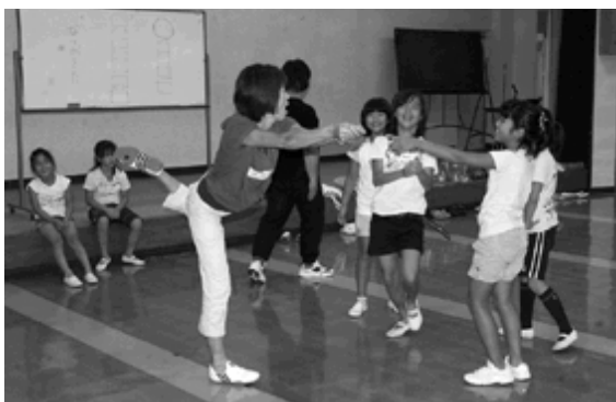
体を目いっぱい使って表現する

参加したのは、町民ミュージカル出演者を中心とした、子どもから大人まで計28人で、「楽しかった。機会があればまた参加したい」などと感想を話していました。