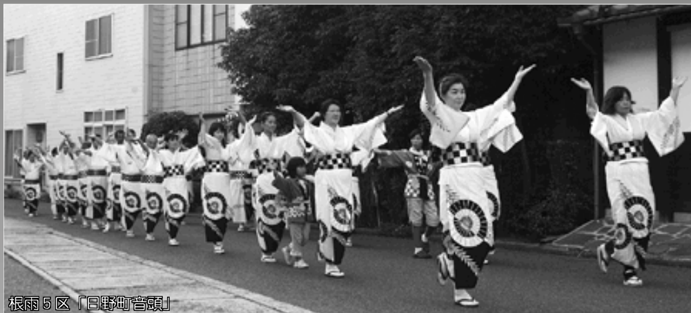
根雨5区「日野町音頭」