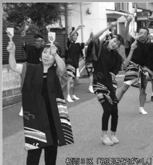
根雨3区「祇園鳴子ばやし」