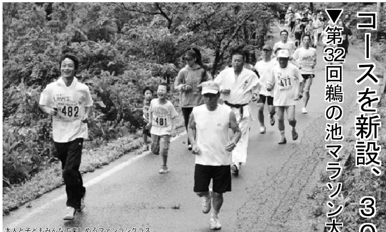
大人と子どもみんなで楽しめるファンランクラス