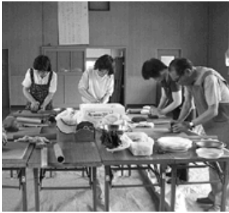
真剣に土をこねる

また、隣保館長からの「楽しかった人は？」という問いかけに「ハイ！」と全員が手を上げて答えていました。