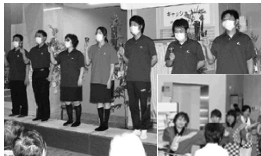
事務局によるハンドベル