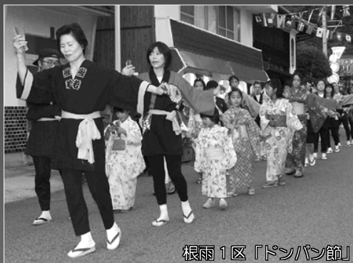
根雨1区「ドンパン節」