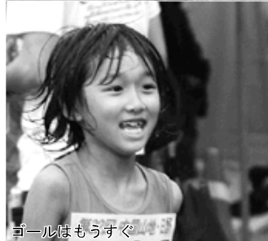
ゴールはもうすぐ