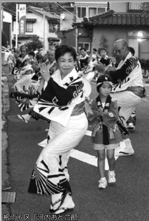
根雨6区「河内おとこ節」