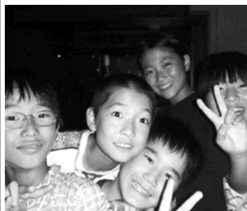
子どもたちは元気いっぱい

生活体験合宿でお世話になった「地域の先生」の皆さん、ありがとうございました。子どもたちの成長には皆さんの力が必要です。今後ともよろしく願います。