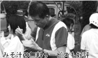
みそ汁の無料サービスも好評