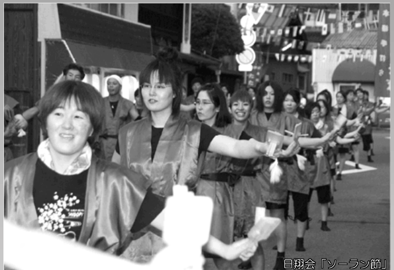
日翔会「ソーラン節」