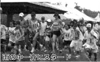
雨の中一斉にスタート