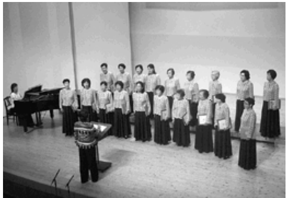
コーラスグループアザレアは「大山賛歌」など披露