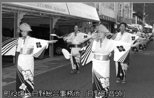
町役場・日野総合事務所「日野町音頭」