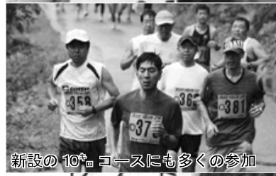
新設の10kmコースにも多くの参加

7月26日、町制50周年記念第32回中国山地日野鵜の池マラソン大会(同実行委員会主催)が、鵜の池湖畔で開かれ、県内外から約300人が参加し、健脚を競いました。今回からコースを一部変更し、2・3km、5km、10kmの3コース、17クラスで競技を行いました。また、今回はマラソンランナーの谷川真理さんが招待選手として参加し、参加者と一緒に汗を流しました。 町内入賞者(第3位まで掲載 敬称略) 【Aクラス】第2位〃蔵本直也、【Cクラス】第3位〃渡部夏帆、【Fクラス】第2位〃安達奨悟、第3位〃生塩駿也、【Gクラス】第2位〃長住康一