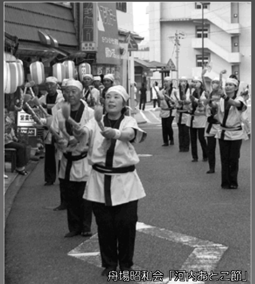
舟場昭和会「河内おとこ節」