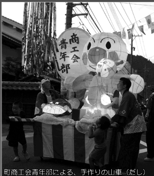
町商工会青年部による、手作りの山車（だし）