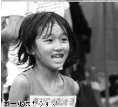
ゴールはもうすぐ