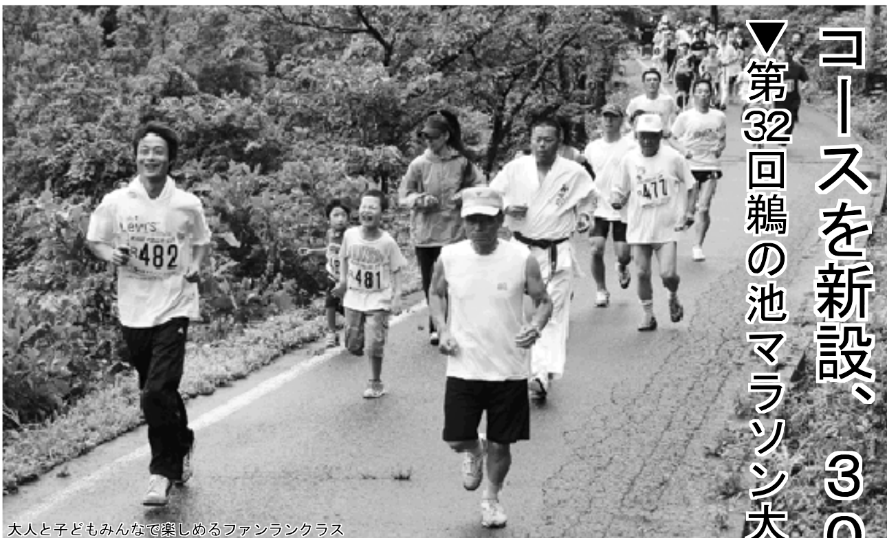
大人と子どもみんなで楽しめるファンランクラス