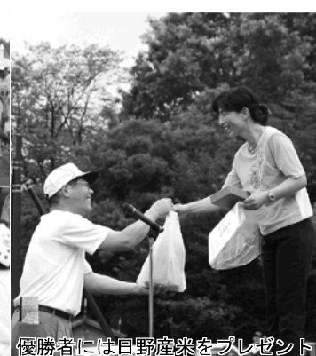
優勝者には日野産菓をプレゼント