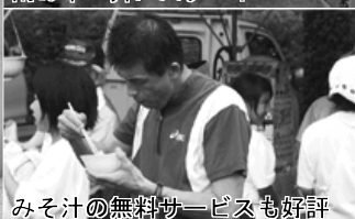
みそ汁の無料サービスも好評