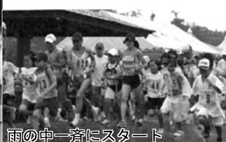
雨の中一斉にスタート