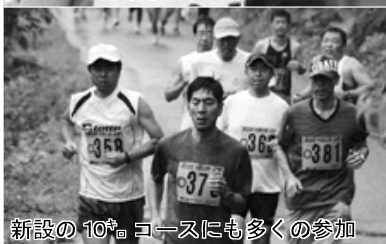
新設の10kmコースにも多くの参加

7月26日、町制50周年記念第32回中国山地日野鵜の池マラソン大会(同実行委員会主催)が、鵜の池湖畔で開かれ、県内外から約300人が参加し、健脚を競いました。今回からコースを一部変更し、2・3km、5km、10kmの3コース、17クラスで競技を行いました。また、今回はマラソンランナーの谷川真理さんが招待選手として参加し、参加者と一緒に汗を流しました。 町内入賞者(第3位まで掲載 敬称略) 【Aクラス】第2位〃蔵本直也、【Cクラス】第3位〃渡部夏帆、【Fクラス】第2位〃安達奨悟、第3位〃生塩駿也、【Gクラス】第2位〃長住康一