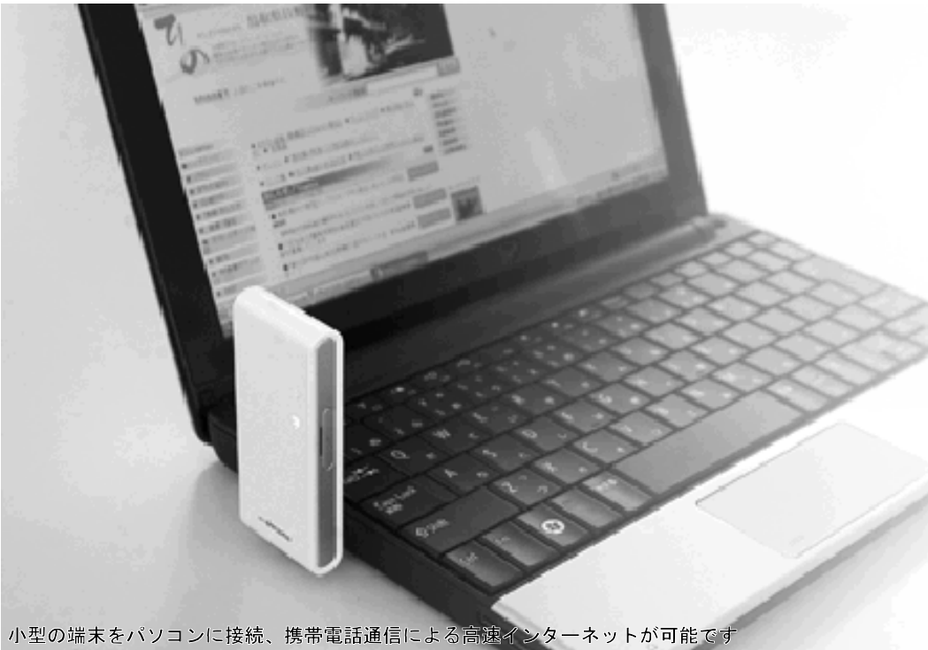
小型の端末をパソコンに接続、携帯電話通信による高速インターネットが可能です

国において、現在の地上波アナログテレビ放送を、平成 23 年 7 月 24 日までにデジタルテレビ放送に移行するよう準備が進められています。また、平成 22 年度までにブロードバンド（高速インターネット）が整っていない地域の解消の取り組みも進められています。