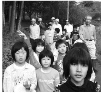
みんなでにぎやかに

の生体説明を受け、竹や木に産み付けた卵や親ガエルを見るのができ、子どもたちは大喜びでした。その笑顔を見て地域の人も大喜びでした。