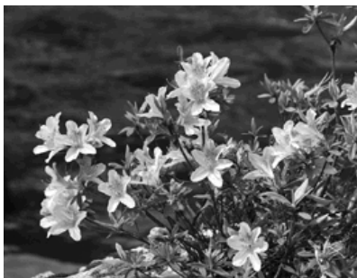
寝覚峡のキシツツジ

日野町内の植物については、キシツツジの紹介がありました。これは、県内でも日野川中流域のみに自生していると考えられており、寝覚峡に自生しているとのこと。守る活動が地域おこしにもなるのではと訴えられました。 学園生は普段見ることができない植物を見ることができ、感激していました。