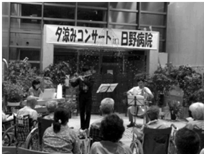
昨年の「夕涼みコンサート」の様子