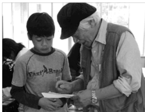
小黑さん（右）からデザインのアドバイス

町では、いただいた寄付を、滝山公園への植樹など、滝山の観光振興に使うこととしています。