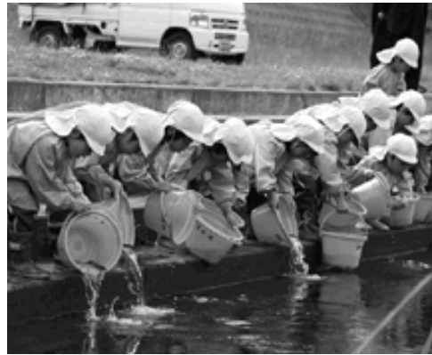
元気なアユに興味津々

あなたの声や地域・職場での話題をお寄せください。 ★役場企画政策課まで（電話72-0332）