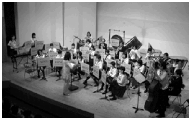
日野中吹奏楽部と迫力の演奏を聞かせる

また、日野中学校吹奏楽部も特別出演し、数曲を合同で演奏、大きな拍手が送られました。