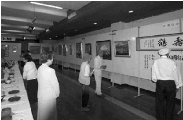
見事な書や絵画、陶芸などが並ぶ

訪れた人たちは、見事な出来栄えに感心しながら見入り、出品者に見どころを尋ねたりしていました。