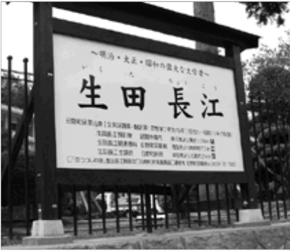
町内の長江ゆかりの地などを紹介

5月14日に行われた除幕式で、河川会長は「皆さんの力で立派な看板ができました。町の文化活動がますます発展するようお願いいたします」と喜びを語りました。