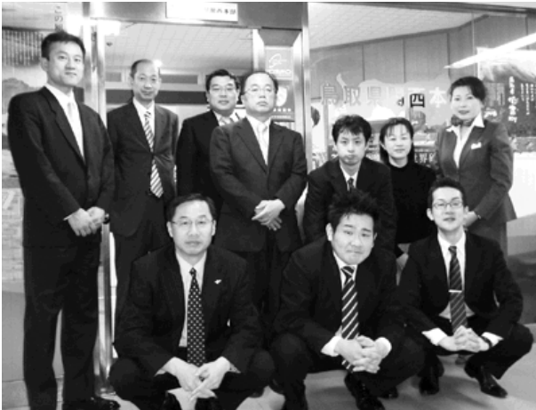
私たちがお待ちしております

鳥取県関西本部をご存じですか？ 「行きたい鳥取！住みたい鳥取！ 帰りたい鳥取！」をキャッチフレーズに、 当本部が皆さんの力になります。 進学、就職、転勤など、 この春から関西に引越される人、 すでに関西にお住まいの人にも ぜひお知らせください。