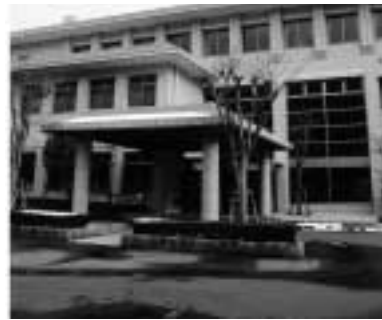
一日も早い赤字解消を

成費十万七千円。公民館修理費十六万八千円。十二月定例会以後、削減努力で、財源不足額三千六十六万千円となりました。