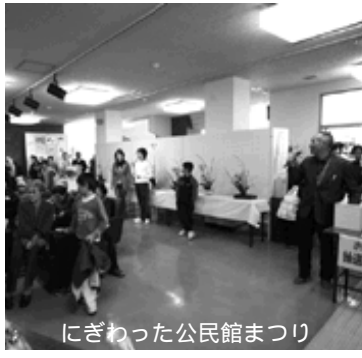
にぎわった公民館まつり

りできた方が多い、他のイベントと同じ時期なので来人も困るのではないかと、催し物が終わるとすぐ帰ってしまおう人などがほとんどで、館内が閑散としてしまうので工夫が必要である」といった意見が出ました。これらの意見を平成20年度に反映させることを確認しました。