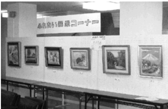
展示コーナーは公民館ロビーにあります

町公民館では、ふれあい展示コーナーの出版者を募集しています。みなさんが日ごろから取り組んでおられる創作活動を出展してみませんか。絵画、写真、書などジャンルは問いません。希望される方は、町公民館までご連絡ください。よろしくお願します。