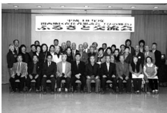
年に一度懐かしい顔ぶれがそろう

会員らは、11日朝大阪をバスで出発、金持神社、サワガニ養殖場、農産物加工所「大夢多夢」を見学した後、リバーサイドひので町長はじめ町関係者やJA、おしどりグループらとの懇親会が開かれ、まちの特産品に舌鼓を打ちながら、町政などについて意見交換しました。