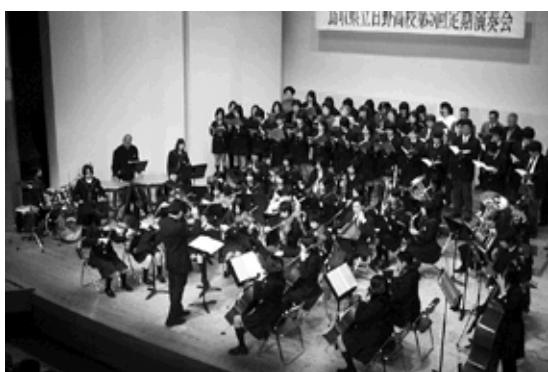
全員による華やかなフィナーレ

演奏会の最後には合同演奏が行われ、出演者全員、約70人による迫力あるハーモニーに、聴衆からは大きな拍手が送られました。