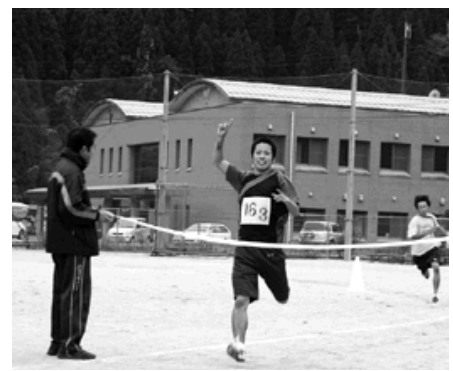
白いテープが待つゴールの瞬間