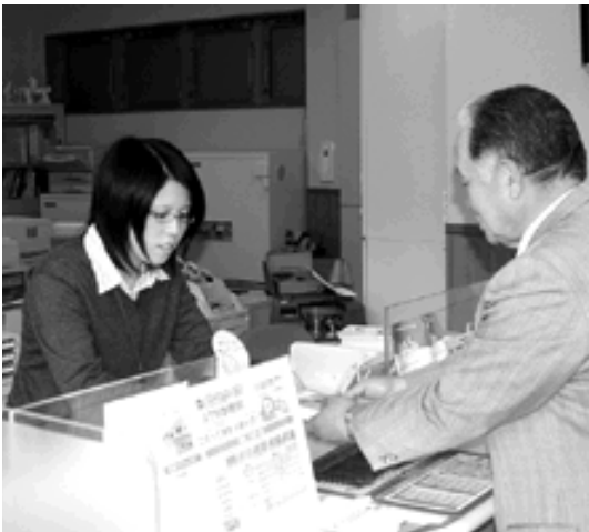
一人ひとりの人権意識を育てていきましょう

一人ひとりが人権を尊重する社会を目指そうと、12月4日から10日まで、第58回人権週間が行われました。