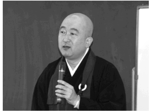
各地で講演活動が続ける三島さん