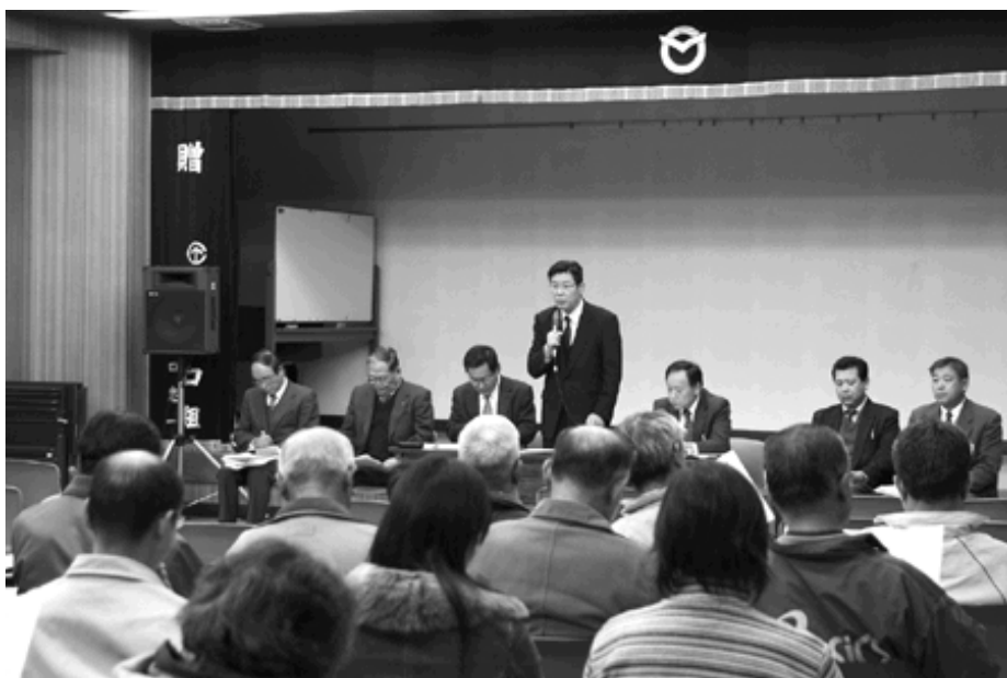
説明に先立ち、あいさつする景山町長