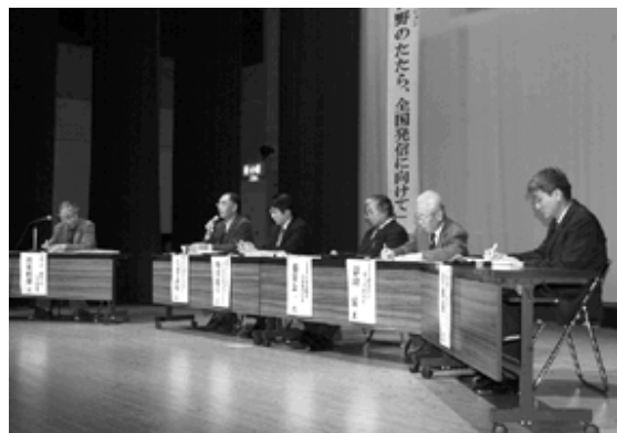
たたらや山陰の文化などについて議論

ここでは、古代から続いたたたらを全国発信するためにどうすればよいか話し合われ、近藤家や町並みを生かしたまちづくりや、人同士の連携、インターネットを使った情報発信などの意見が出されました。