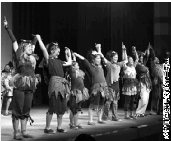
回野加に佐の山賊河童たち