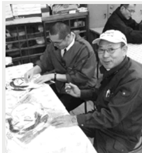
童心に返って風作り