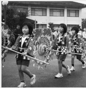
傘踊りで華やかに