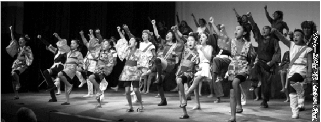
ランナーは国民歌『きりぎりすの町』