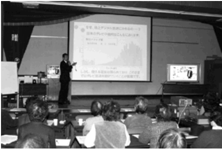
スクリーンを使ってわかりやすく説明

なぜ、地デジになるのかということについては、「日本のテレビ中継局は約3500局と数が多い。このままの状態では電波を使うことができなくなりテレビ放送を続けて