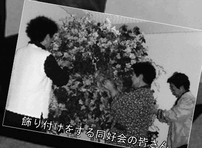
飾り付けをする同好会の皆さん

「ホール森の音楽隊」への入口、ホワイエを飾る華やかなアートフラワー。 ホールの雰囲気美しく和らげ、訪れる人たちに喜ばれています。 季節ごとの飾り付けていただいているのは、アートフラワー同好会の皆さんです。