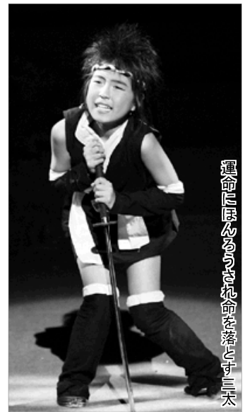
運命にほぐるさだれ命を落とす三太