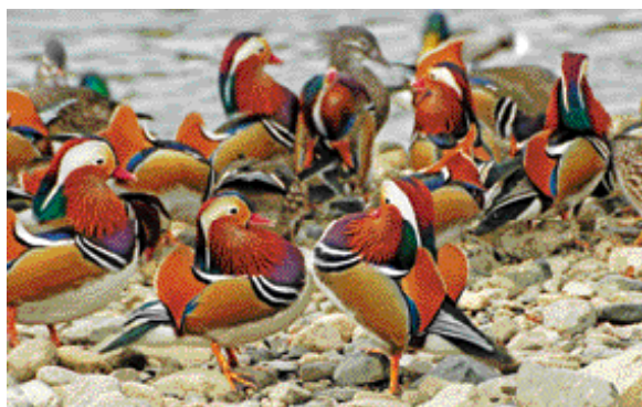
『今シーズンもよろしくね』