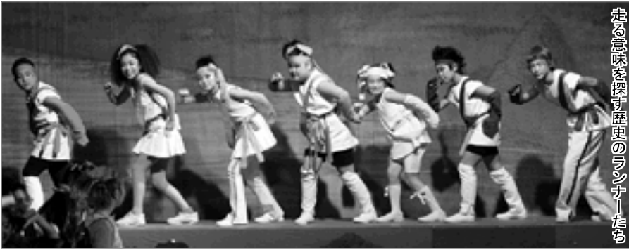
走る意味を探す歴史のランナーたち