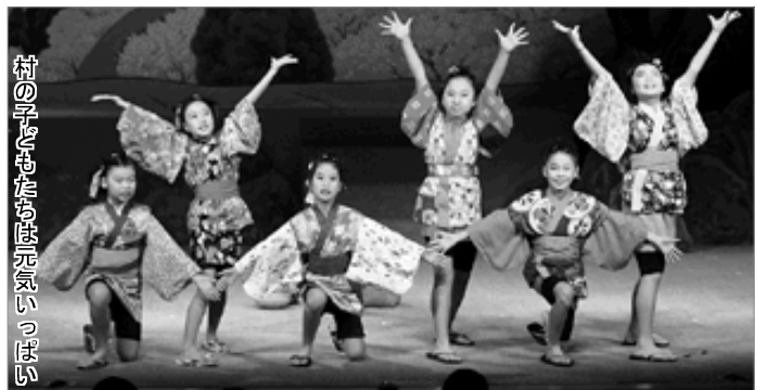
村の子どもたちは元気いっぱい