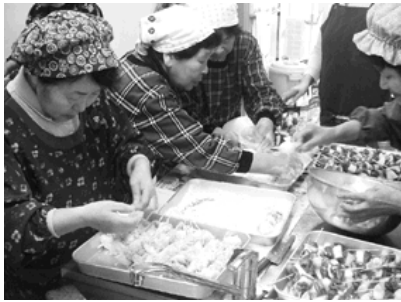
楽しみながら手際よく

教室は女性が対象で、にぎやかに和気あいあいとした雰囲気でした。お昼は男性も参加しての大昼食会。初めての料理に「こんな食べ方もいいなあ」「お酒が欲しくなるなあ」な