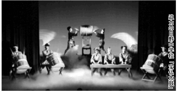
迫初の回野中學校『京太太鼓』