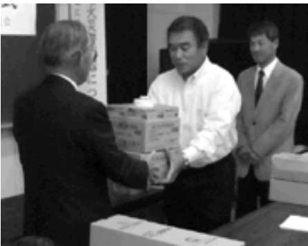
福田会長(左)から各自治会へ手渡されました

平成18年6月1日以降の新築住宅には、住宅用火災警報器の設置が義務付けられています。また、既存の住宅には、平成23年5月末までに設置する必要があります。