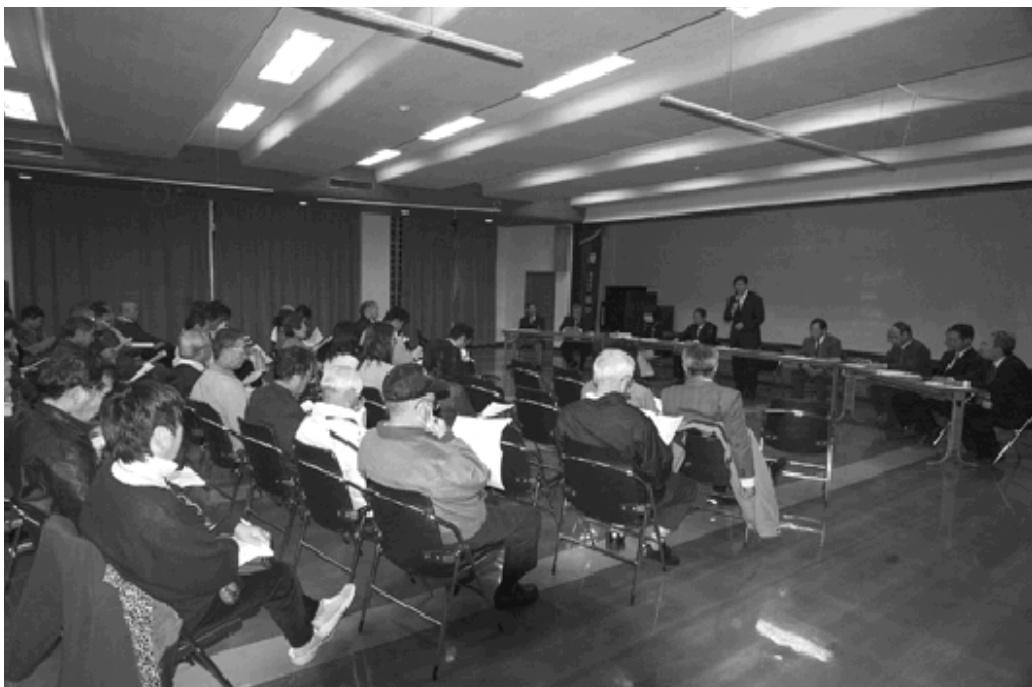
多くの町民が関心を持って説明を聞く