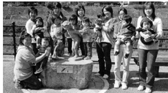
カワコ公園へお散歩

連絡先 ひのっこ保育所(電話 72 0238) 役場健康福祉課(電話 72 0334)