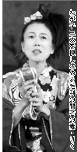
おが子三太を捜し求める毛利の闇者の妻・ゆく