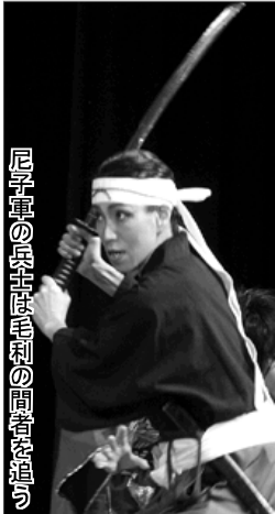
尼子軍の兵士毛利の闘志を描く