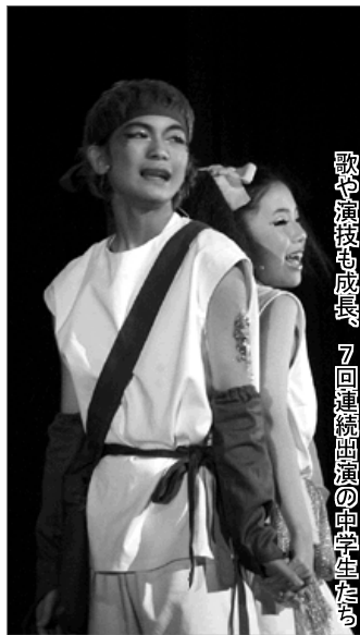
歌や演技も成長、7回連続出演の中学生たち