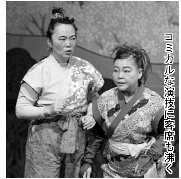
コミカルな演技に客席も沸く