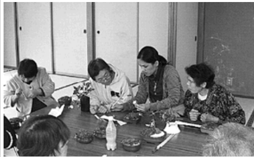
繊細な作業ですが楽しいです