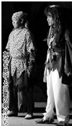
友也を見守る河童の親分たち