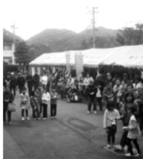
多くの人出だった抽選会