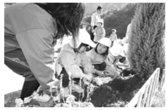
植え方を高校生のお姉さんに教えてもらいました