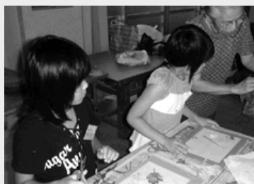
地域子ども教室の様子です(左:おしばな教室、右:花植え教室)