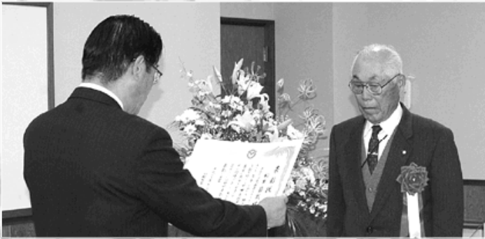
町長から感謝のことばが送られる

今年度、まちの発展に貢献された皆さんを表彰する、第39回町表彰式を、11月7日、町役場で開きました。