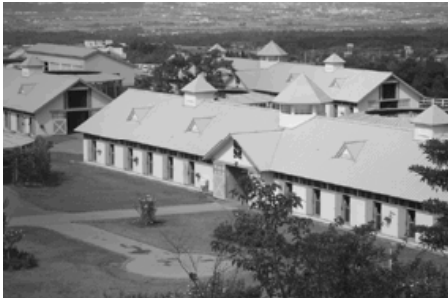
広い敷地にきゅう舎が並ぶ

編集 日野町公民館 〒689-5131 日野町黒坂1243番地1 電話：74-0212 FAX：74-0105 E-mail：kouminkan@town.hino.tottori.jp