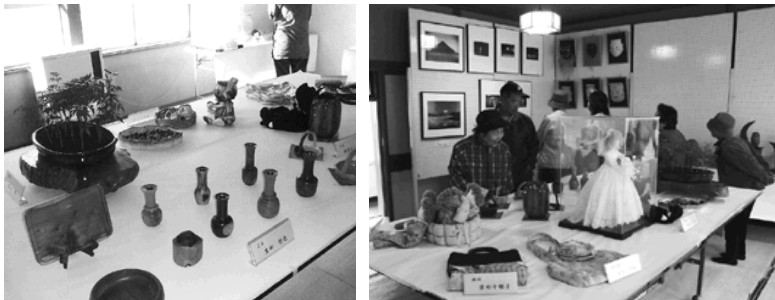
木工品、手芸品などの力作がずらり

お茶をいただきながら話を聞くと、まだまだ作品が眠っているようで、来年の文化祭も楽しみにになりました。