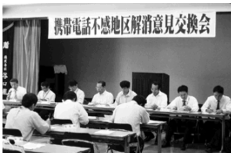
携帯電話事業者3社がそろっての意見交換会

これは、県西部の市町村が、総務省や携帯電話事業者のNTTドコモ、au、ソフトバンクと意見交換できるように、県主催で開かれたものです。