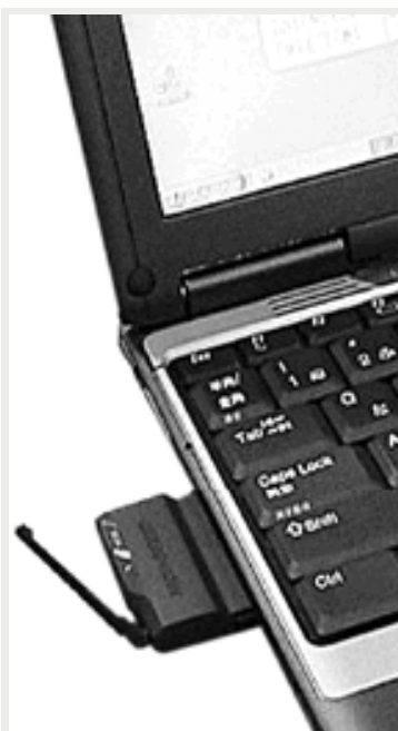
パソコンに差して使用するタイプのデータ通信カード

対応したパソコンやパソコン本体にUSBやPCカードスロットに対応機器を接続するなどしてインターネットができます。