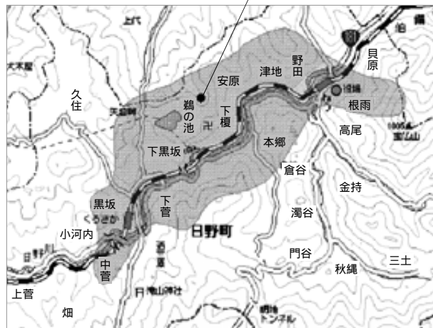
中日野局エリア図（グレーの部分）