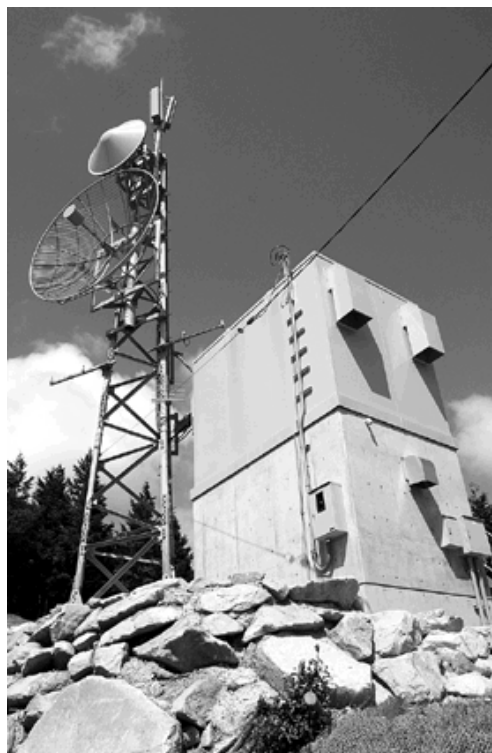
新設された中日野局

りますので、ワンセグ対応携帯電話などの移動端末でもテレビが視聴できるようになります。