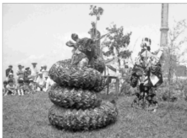
ヤマタノオロチ神話（船通山）

紅葉を楽しみながら、奥日野・奥出雲に隠された「神話・伝承」の地や、「たたら」に関わりが深い里を訪ねます。