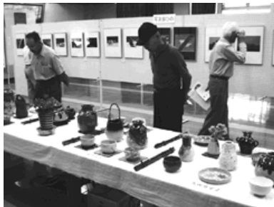
心のコもった作品たち