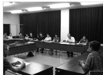
住民から率直な声があがる

【お知らせ】地域との意見交換会の「要望がありましたら、日野病院(電話72 0351)までご連絡ください。