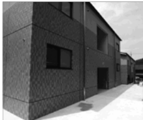
新しいまちづくりの

マンションの規模は、2棟に合計8世帯間取りはすべて2LDKで、これにより定住人口の増加、まちの活性化が期待されます。