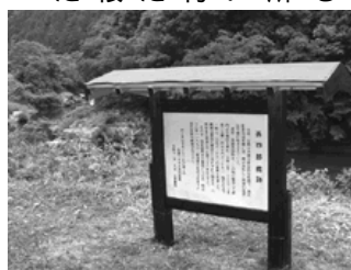
看板には橋の歴史を記載

その昔、下黒坂と本郷を結ぶ日野川にかつていた「孫四郎橋」。その歴史を語り継ごうと、6月28日、町ボランティアセンターが橋の跡地付近に看板を設置しました。