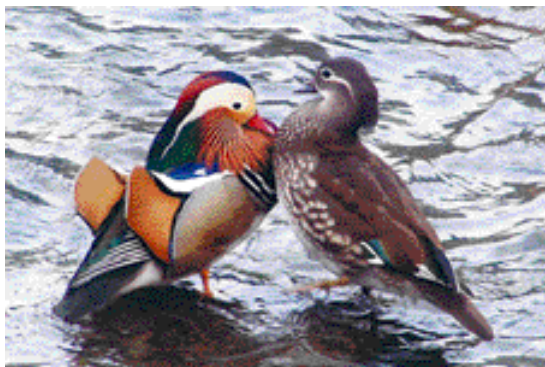
「夕食何にする？ お刺身定食が食べたいよ。エエッ」