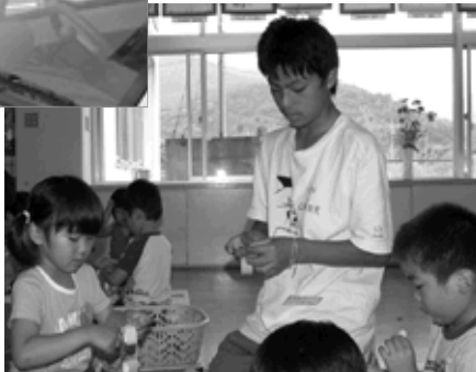
自分が選んだ業種で実際に働いている