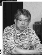
意見に答える浜副院長