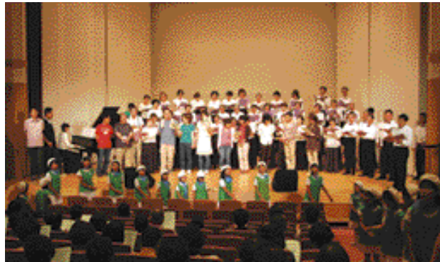
「きらりこの町」合唱のフィナーレ