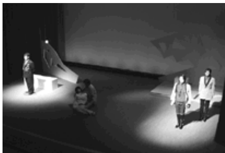
緊張感ただよ舞台