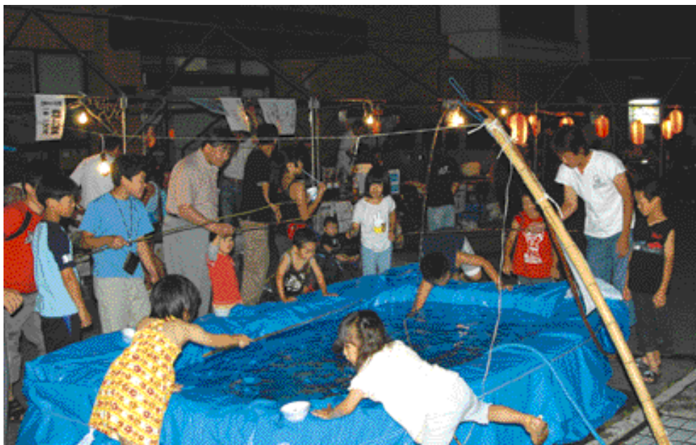
子どもたちに大人気のヤマメ釣りコーナー