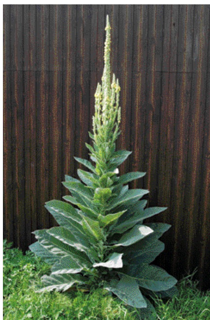
近くで見ると本当にデカイ！

まちで見つけた「珍しいモノ」「紹介したいモノ」などなどありましたら、役場総務企画課まで情報を！