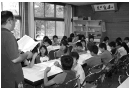
合宿初日、生活の諸注意などを聞く