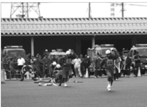
優勝した小型ポンプ操法の部

町消防団からは、4月の町審査会で選ばれた選手が出場し、ポンプ車操法の部で準優勝、小型ポンプ操法の部では優勝と大健闘し、7月17日に鳥取市で開かれる県大会への出場が決まりました。