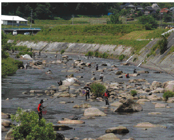
アユを追う太公望たち

選手たちは、野田(下樓間)の友釣りエリアで自慢の腕をふるい、次々とアユを釣り上げていました。