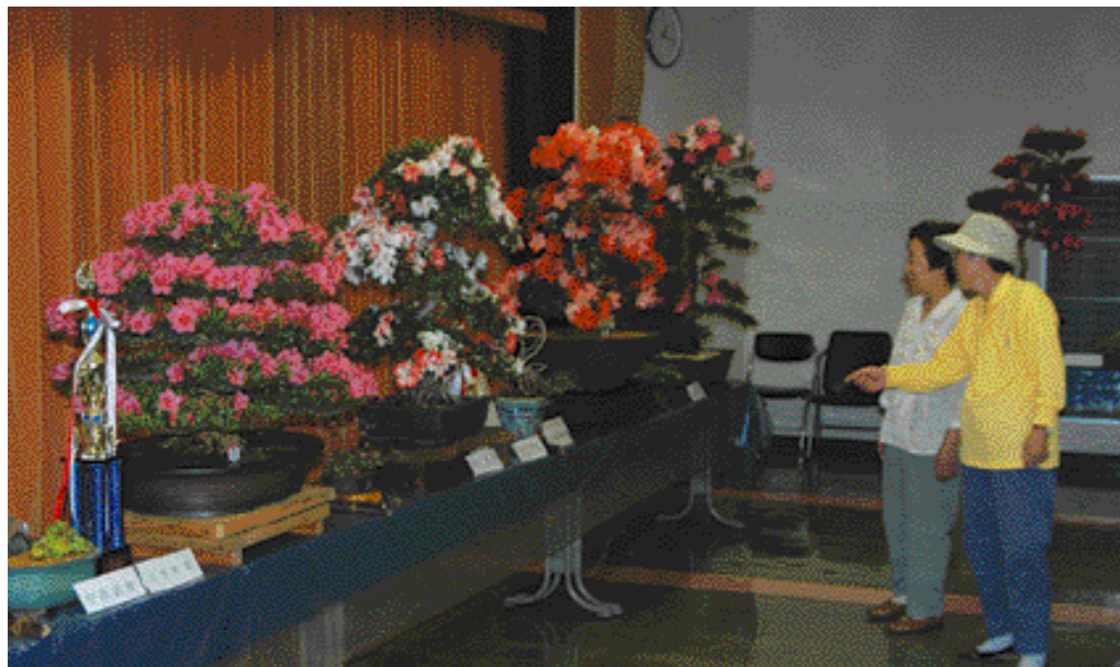
色とりどりの見事な出来ばえ

町内のさつき・盆栽愛好者の作品展、第33回さつきまつりが6月7日～9日、開発センターで開かれました。