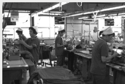
従業員のほとんどが町内の女性です

工場長さんは、「黒坂工場は、地元の方が仕事と家庭を両立できる環境づくりに取り組んでいます。小学校も近くにあり、お子さんの緊急のときはもちろん、入学式や参観日にも出られるよう調整したりと、アットホームな職場で従業員も安心して働いています。また、縫製の仕事は、職が身に付く技能職です。未経験の方でもしっかり指導しますので、どんどん応募してみてください」と話します。