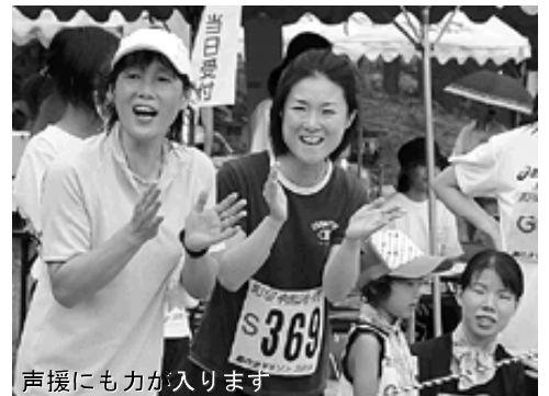
声援にも力が入ります