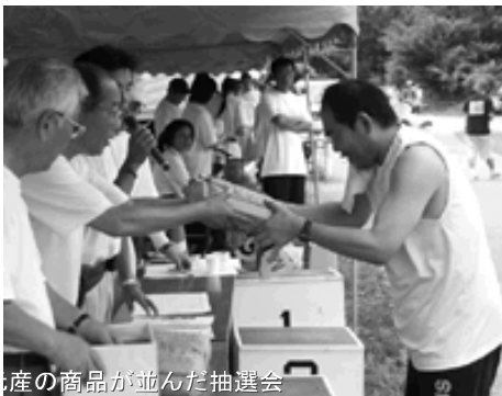
産の商品が並んだ抽選会