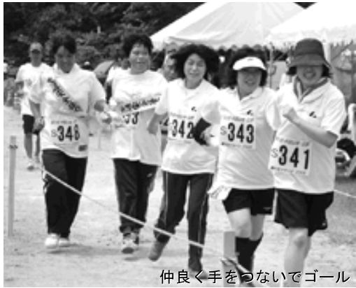
仲良く手をつないでゴール