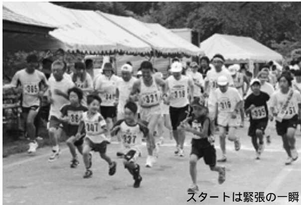
スタートは緊張の一瞬