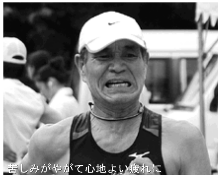
苦しみがやがて心地よい疲れに