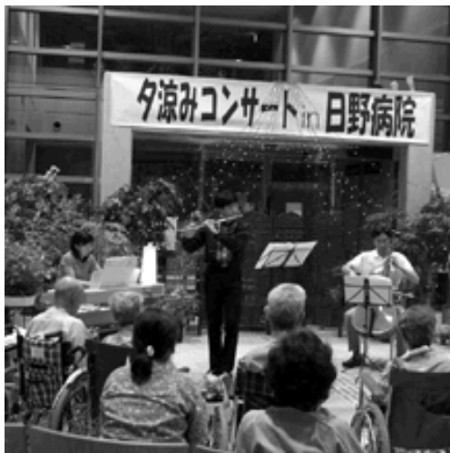
やさしい音色が響き渡る

日ごろ病院を支えてくださるま ちの皆さん、患者の皆さんに癒やし の時間を過ごしていただこうと、7 月25日、夕涼みコンサートを病院正 面玄関で開き、約100人が参加し ました。