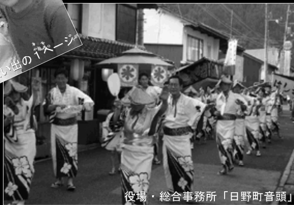
役場・総合事務所「日野町音頭」