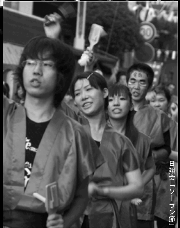
日翔会「ソーラン節」