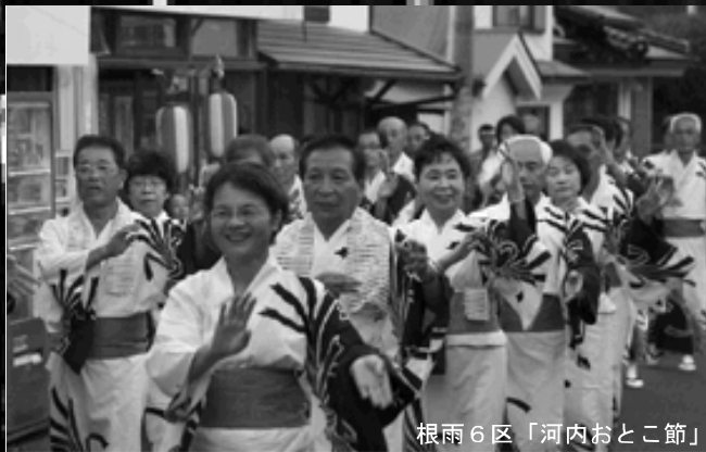
根雨6区「河内おとこ節」