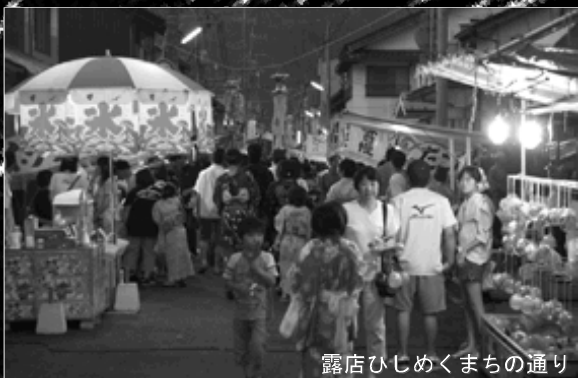
露店ひじめくまの通り