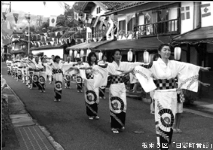
根雨5区「日野町音頭」