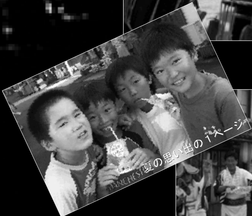
夏の思い出の1ページ