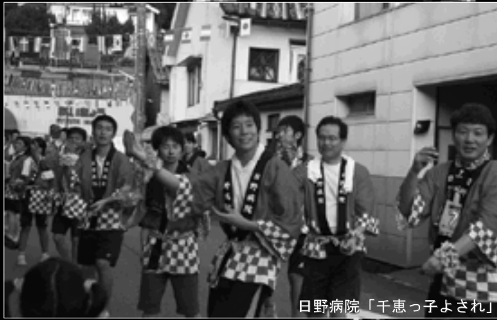
日野病院「千恵っ子よされ」