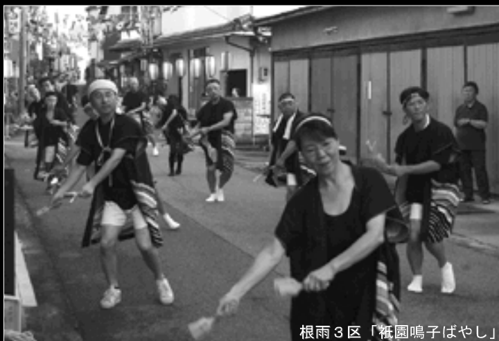
根雨3区「祇園鳴子ばやし」