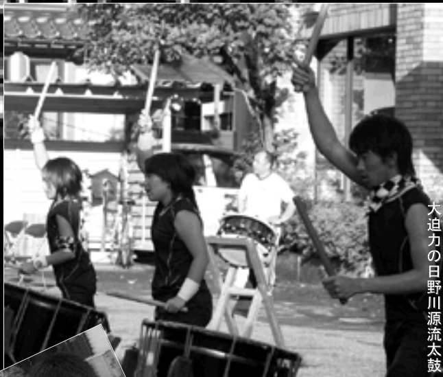
大迫力の日野川源流太鼓