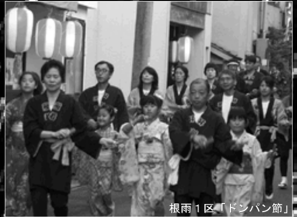
根雨1区「ドンパン節」